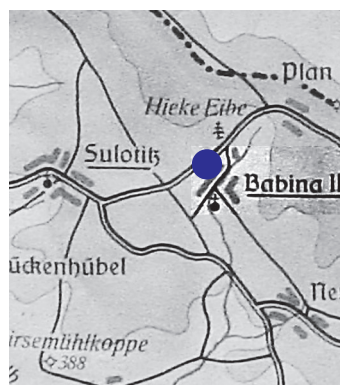
Na mapě 'Karte des Kreises Aussig' (Prof. Blumtritt, 1939) je dokonce zmiňován Tis W. Hieke (Hieke Eibe).